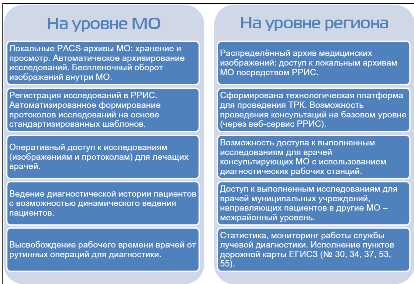
Рис. 3 – РРИС: новые возможности

По итогам внедрения и в ходе эксплуатации РРИС определены новые возможности на всех уровнях управления здравоохранения Краснодарского края, которые несет в себе распределенная модель хранения МИ (рис. 3).