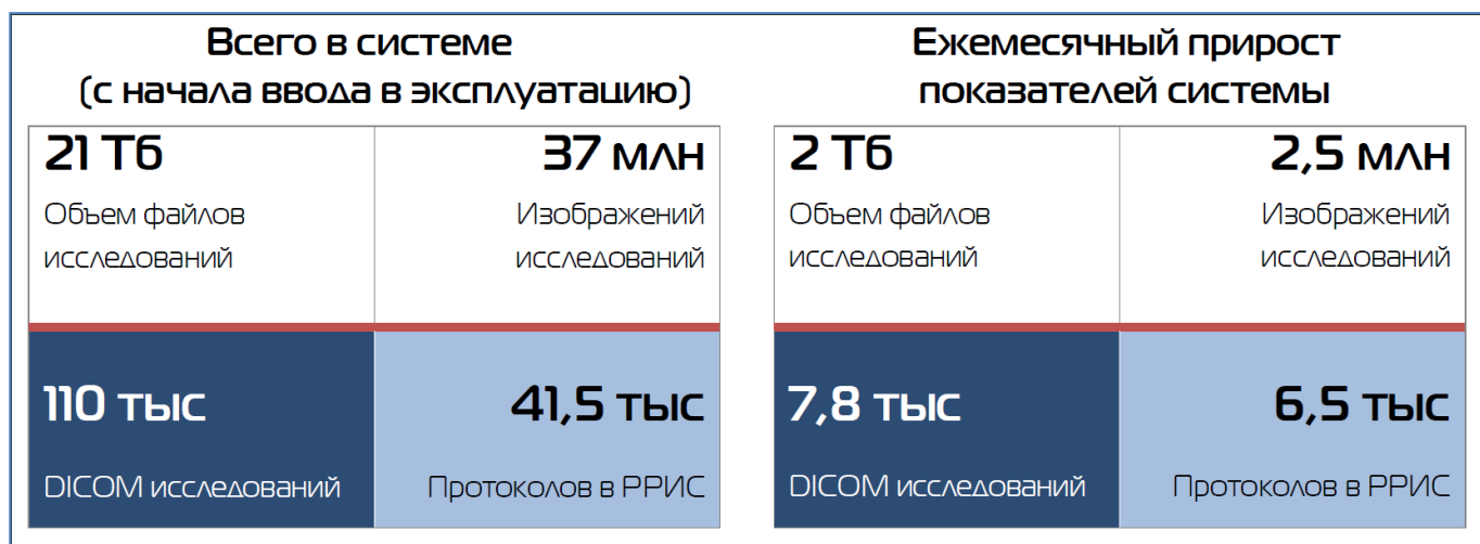
Рис. 2 – Показатели работы РРИС

Обеспечен ежедневный мониторинг работы РРИС таких показателей, как количество исследований, изображений, емкость дискового пространства и др. (рис. 2). Ежемесячно локальные архивы пополняют 7,8 тыс DICOM исследований, 2,5 млн МИ. На данный момент уже содержат 109 708 исследований, 37 130 225 изображений. Общая емкость дискового пространства локальных архивов составляет 65 529 ГБ, из которых занято 20 887 или 31,9% .